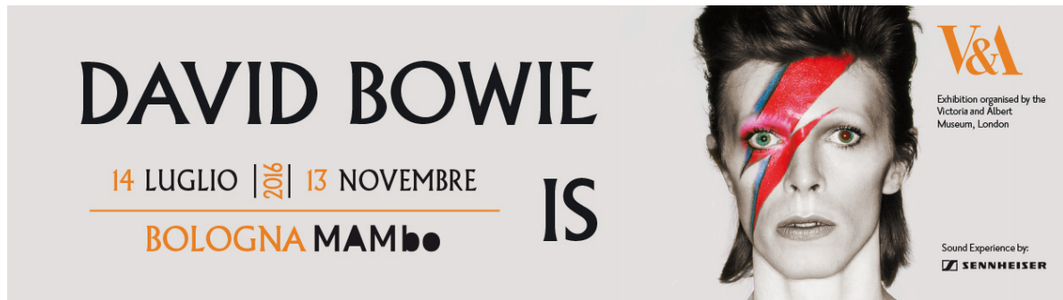
Foto di Brian Duffy per la copertina dell'album Aladdin Sane (1973)